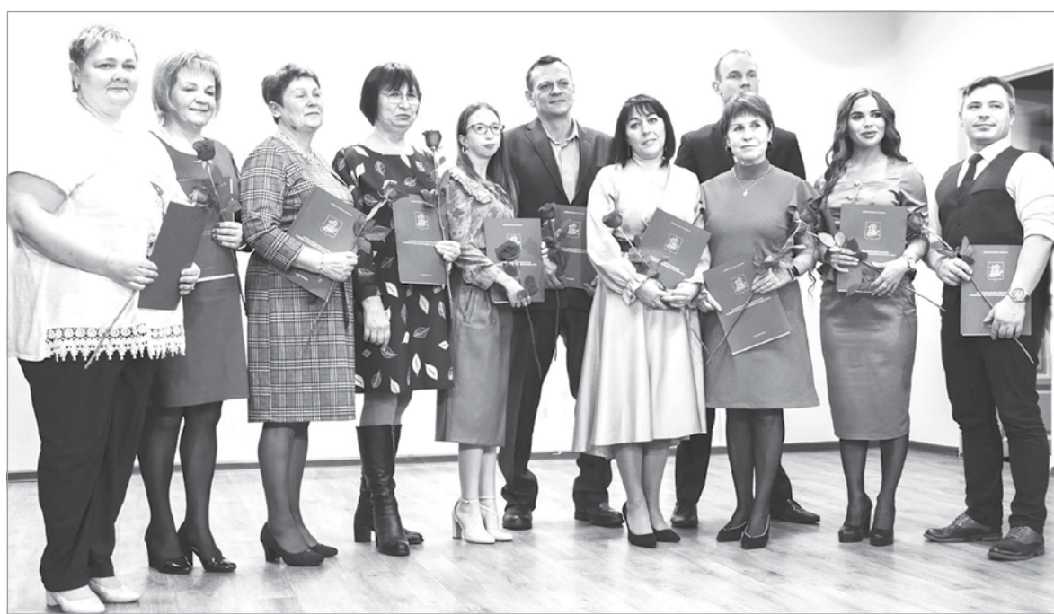
Награды – педагогам школы