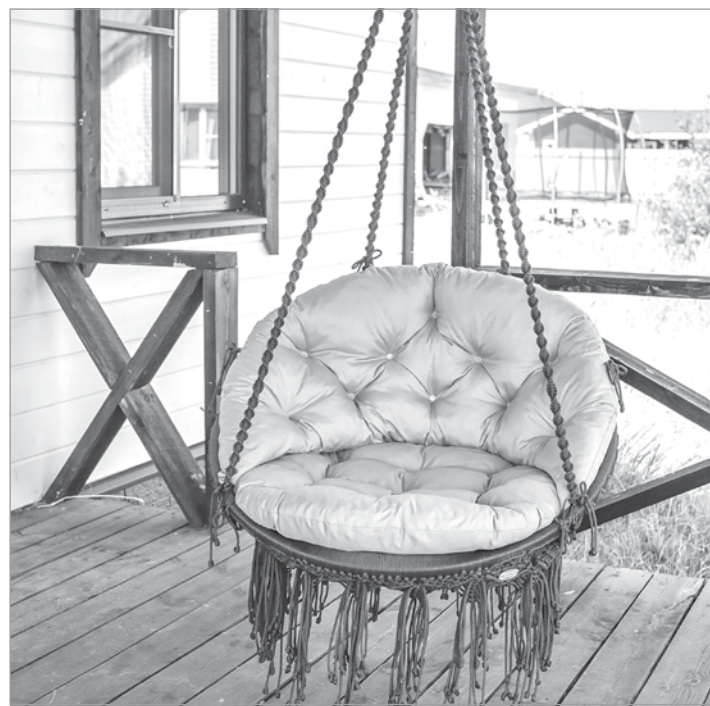
Подвесное кресло в технике современного макраме