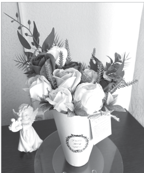
Букет-композиция из цветов, сделанных из мыла